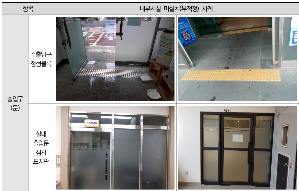
〈표 III-6〉 내부시설 미설치(부적정) 사례