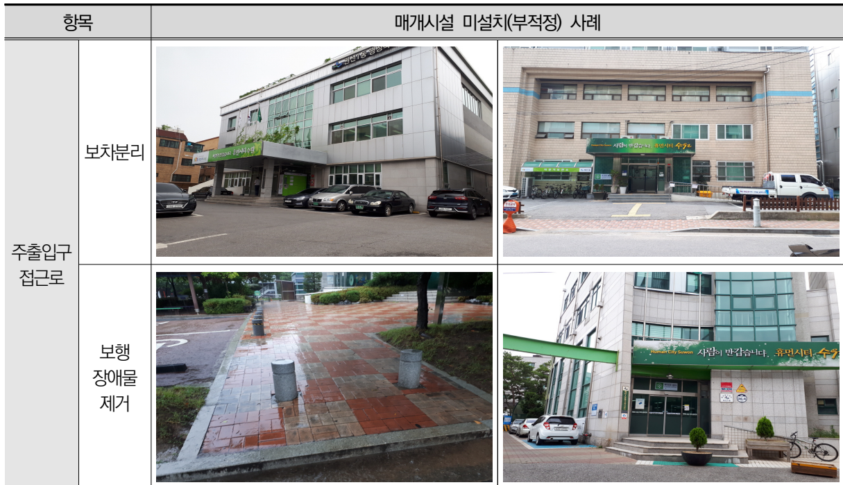
〈표 Ⅲ-4〉 매개시설 미설치(부적정) 사례