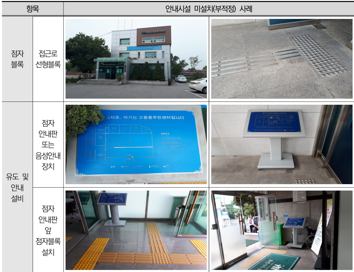
〈표 III-10〉 안내시설 미설치(부적정) 사례