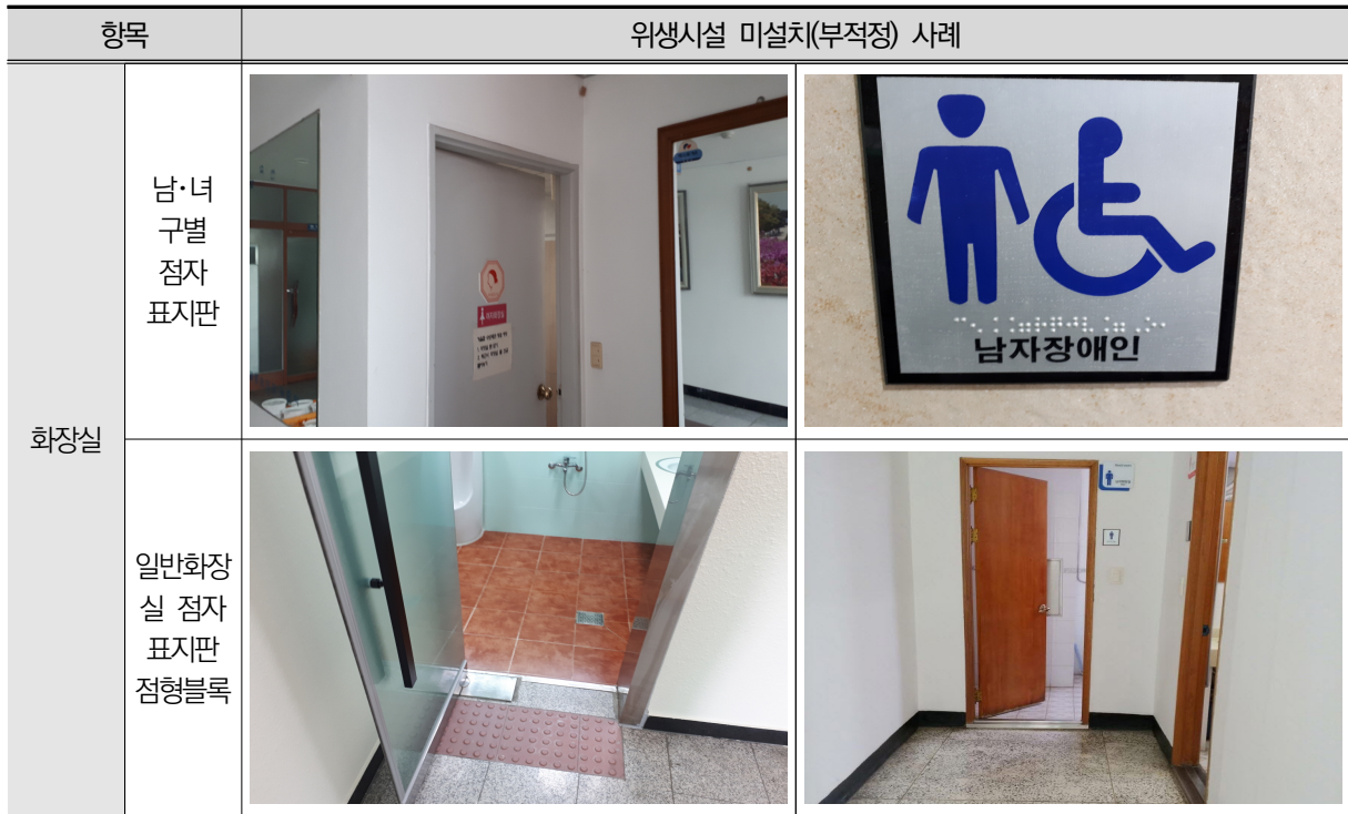
〈표 Ⅲ-8〉 위생시설 미설치(부적정) 사례